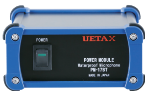
専用ファントム電源 PM-17BT (付属)

水中マイクを原点に開発された全天候型防水マイクです。 雨の中や悪環境でも一般のマイクと同様に利用でき、100mまで延長可能 です。屋外監視用マイクとして利用でき、動物の生態観測における音の収集 に活躍しています。