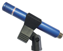
マイクホルダー (オプション)