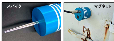
設置面が土や草などの場合、地面に突き挿して使用 コンテナなどの金属壁面に取り付け、内部の振動・音を検知

Lch 3個、Rch 3個のセンサーをそれぞれ縦続接続できますので、広範囲な設置が可能です。